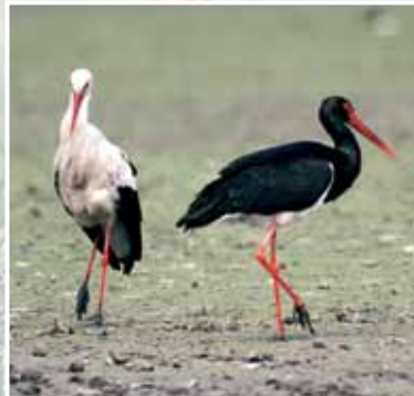
црна и бела рода