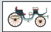
Туристичка организација Сомбор

Издавач: Туристичка организација "Апатин", 25260 Апатин, Петефи Шандора 2/А, тел.: +381 25 772 555