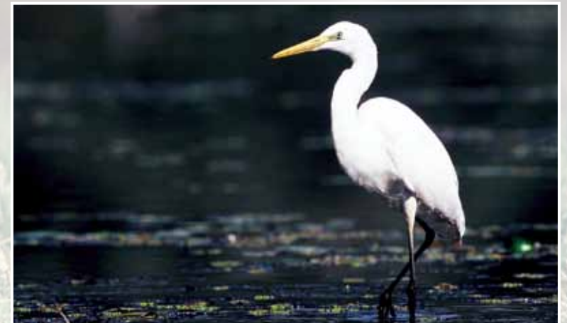
велика бела чапља