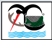
Туристичка организација "Апатин"